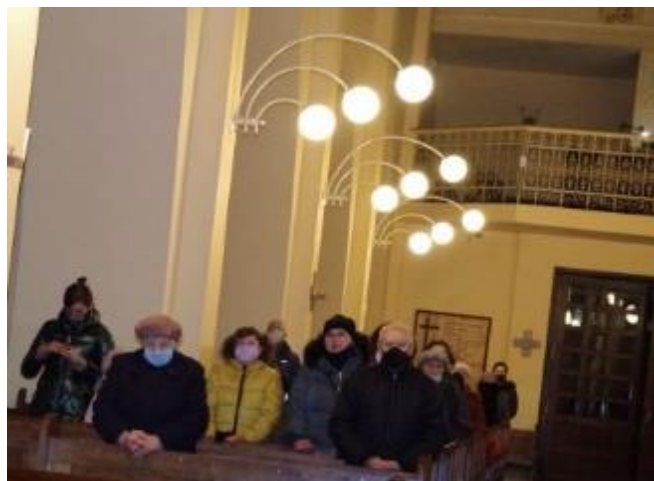
Parafianie przybyli na Mszę Św. imieninową.