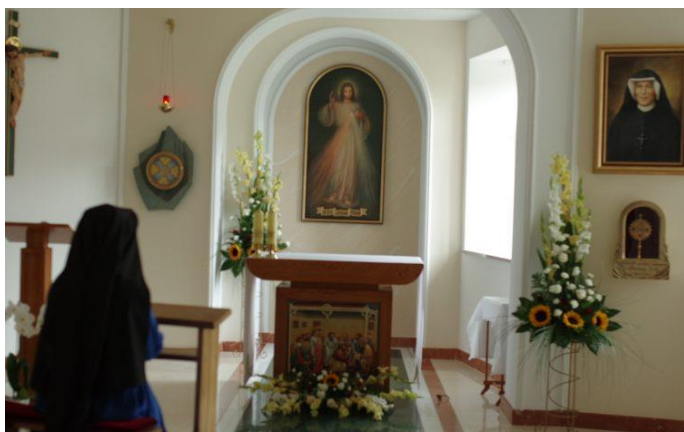
Kaplica z obrazem Jezusa Ufam Tobie w Muzeum na ulicy Krośnieńskiej 9 w Łodzi.

W Płocku Siostra Faustyna doznała pierwszego objawienia obrazu Jezusa. O wydarzeniu tym można przeczytać na tablicy jednej z płockich kamienic na Rynku, na której miejscu stał kiedyś klasztor: „W tym domu, 22 lutego 1931 roku, św. Siostra Faustyna miała pierwsze objawienie obrazu Jezusa Miłosiernego”.