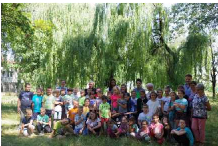
Uczestnicy półkolonii w Świetlicy Środowiskowej

Okrzyk radości wyrrywający się z piersi małych uczestników półkolonii organizowanych w naszej Parafii to najlepsza ich ocena i pochwała.