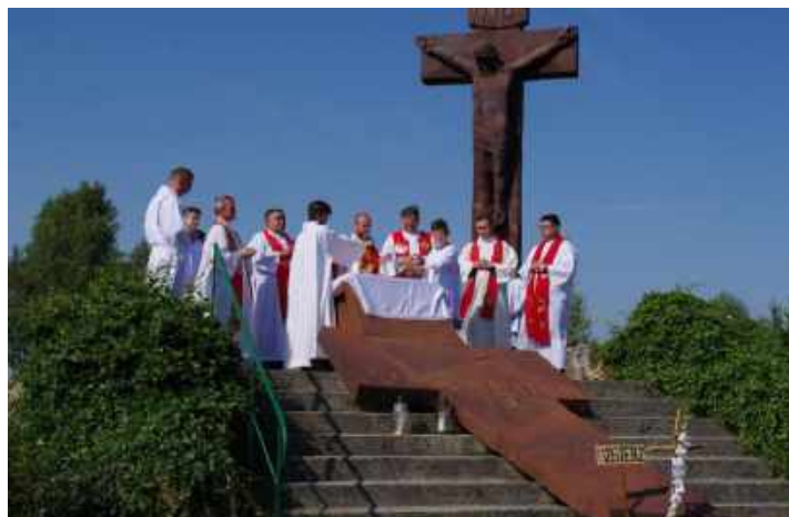
Msza Święta na Przeprośnej Górze.