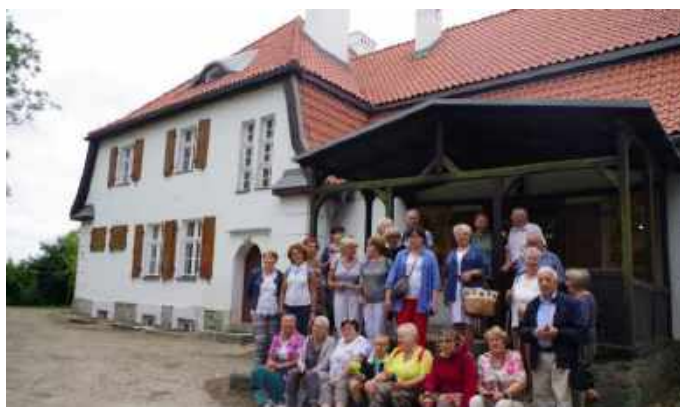
Muzeum Hymnu Narodowego w Będominie

Dotarliśmy też do Swarzewa aby pokłonić się Matce Boskiej Królowej Polskiego Morza. Sanktuarium Maryjne w Swarzewie przez wieki było ostoją polskości i katolicyzmu w trudnych czasach.