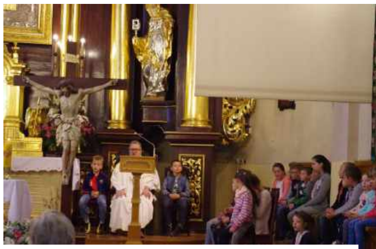
Uczestnicy półkolonii na Mszy Świętej w Łagiewnikach