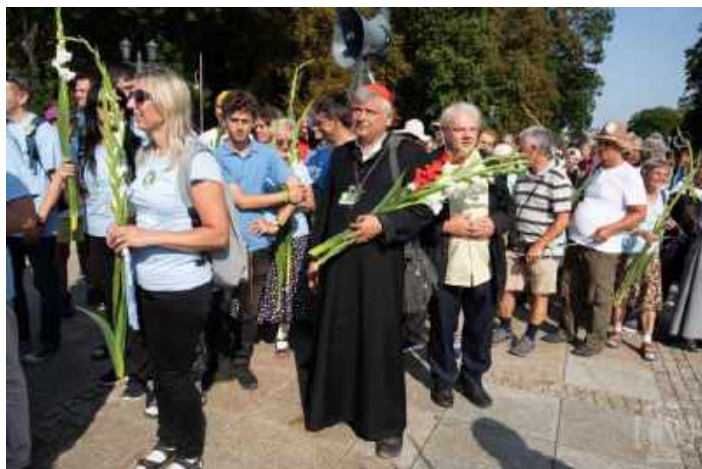
Jałmużnik Papieski Ks. arcybiskup Konrad Krajewski co roku na pielgrzymim szlaku z łódzką pielgrzymką.