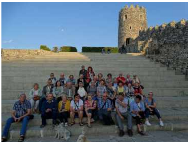
Forteca Rabati ostatni wieczór w Gruzji.

To Ormiański Watykan tutaj siedzibę ma Katolikos, tutaj znajdują się najważniejsze kościoły i zgromadzone są najważniejsze relikwie: włócznia, którą przebito bok Chrystusa, prawa dłoń św. Grzegorza Oświeciciela, drewniana cząstka z Arki Noego, relikwie św. Jana Chrzciciela, św. Szczepana Męczennika, apostołów Tadeusza, Bartłomieja, Andrzeja. Tak jak w Gruzji krzyż św. Nino tak w Armenii „chaczkary” krzyże wykute w tufie wulkanicznym bogato zdobione w ornamenty roślinne są