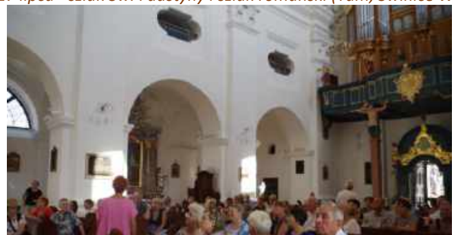
31 sierpnia - Biała Rawska, Rogów - Kościół Niepokalanego poczęcia i Najświętszej Maryi Panny.