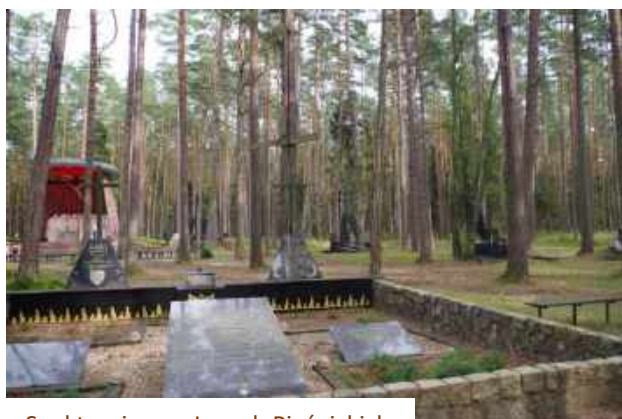
Sanktuarium w Lasach Piaśnickich

Pomodliliśmy się na Kalwarii Wejherowskiej – czwartej, najstarszej w Polsce Kalwarii, zwanej też Kaszubską Jerozolimą - zbudowana na trzech, sąsiadujących ze sobą wzgórzach oraz w pobliskich dolinach, składa się z 26 barokowych, rokokowych i neogotyckich kaplic.