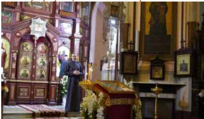
14 września – Łódź; Cerkiew Prawosławna, cmentarze.