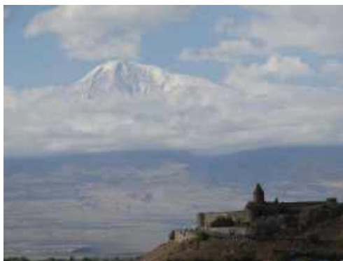
Ararat i klasztor Khor-Virap