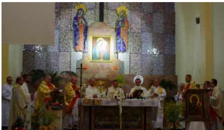
Msza Święta, której przewodniczył ks. arcybiskup Grzegorz Ryś, przed wyjściem pielgrzymów na szlak.

Tradycyjnie 23 VIII 2019 r. w Sanktuarium Matki Bożej w Gidlach pielgrzymujące małżeństwa odnowiły przyrzeczenia małżeńskie.