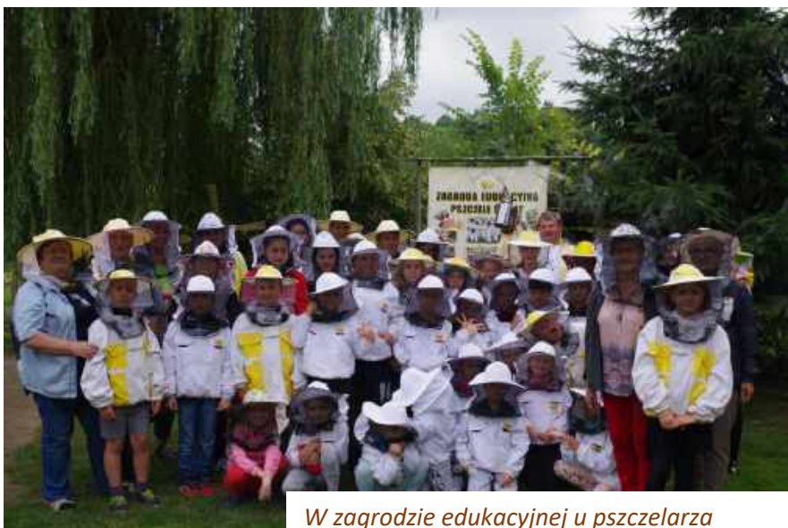
W zagrodzie edukacyjnej u pszczelarza

Do naszej świetlicy zapraszamy dzieci i młodzież, chcących otrzymać pomoc w nauce, a także pożytecznie i ciekawie spędzić czas wolny. A wszystkich chętnych chcących, w ramach wolontariatu, dzielić się swoim czasem z innymi zapraszamy do współpracy.