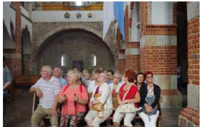
27 lipca - szlak Św. Faustyny i szlak romański (Tum, Świnice Warские)