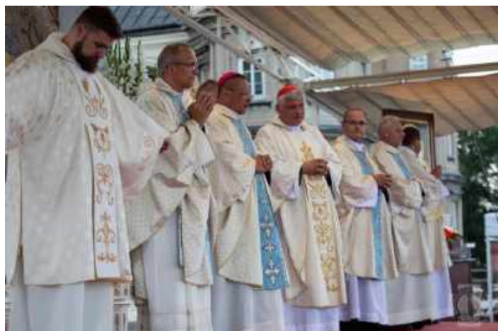
Msza Święta na Jasnej Górze, dla pielgrzymów z archidiecezji łódzkiej, której przewodniczył Jałmużnik Papieski ks. arcybiskup Konrad Krajewski.