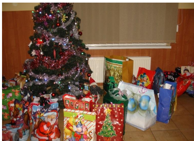
Prezenty od Św. Mikołaja już czekają na dzieci.

Nasze spotkanie rozpoczęło się od występu przygotowanego przez podopiecznych świetlicy, który przybliżył nam tradycje Świąt Bożego Narodzenia. Następnie wszyscy dzielili się opłatkiem i składali sobie nawzajem życzenia. Równie ważnym elementem uroczystości, najbardziej wyczekiwany przez dzieci,