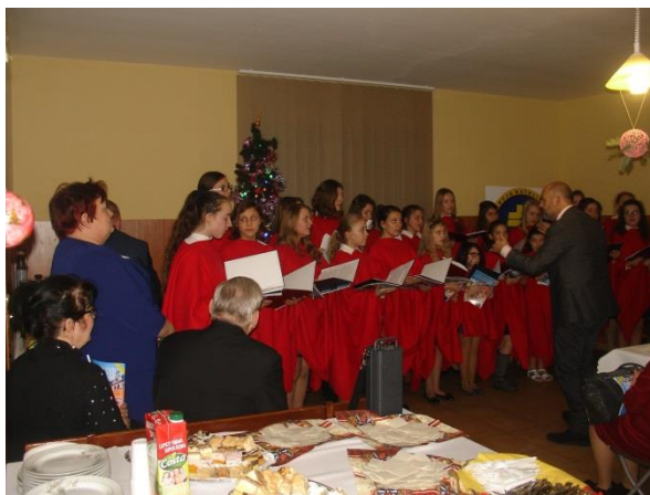
Zespół „Słowikowe Trele” z Zespołu Szkolno – Gimnazjalnego w Słowiku.