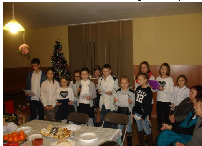
Program artystyczny przygotowany przez dzieci.