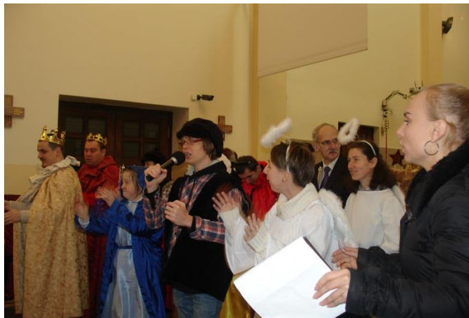
Jasełka w kościele MB Dobrej Rady w Zgierzu.

3 stycznia 2016 roku członkowie koła Polskiego Stowarzyszenia na Rzecz Osób z Upośledzeniem Umysłowym w Zgierzu, który skupia w swoich ramach Warsztaty Terapii Zajęciowej, Zespół Terapeutyczno-