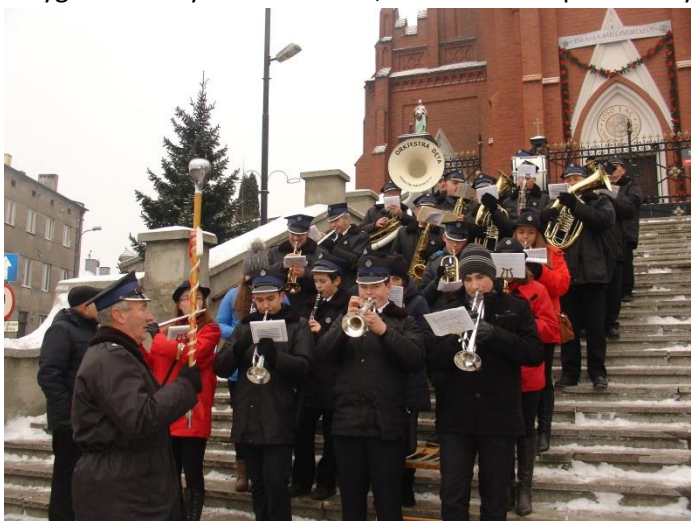
Gminna Orkiestra Dęta z Góry Świętej Małgorzaty.