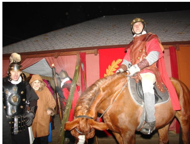
Scena z widowiska „Podróż do Betlejem”.

W dalszej podróży dotarliśmy do Konewki i tam spacerując po Spalskim Parku Krajobrazowym doszliśmy do bunkrów ukrytych w lesie. To wyjątkowe miejsce, gdzie zapoznaliśmy się z historią i podziwialiśmy ogrom