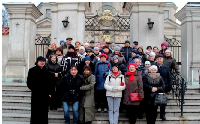
Sanktuarium MB Światorodzinnej w Studziennej.

Akcja Katolicka wspólnie z Polskim Towarzystwem Schronisk Młodzieżowych oraz wolontariuszami Świetlicy Środowiskowej wybrali się 5 stycznia na wycieczko-pielgrzymkę, aby poznać urokliwe zakątki „Ziemi Łódzkiej”. oraz w „Podróż do Betlejem”.