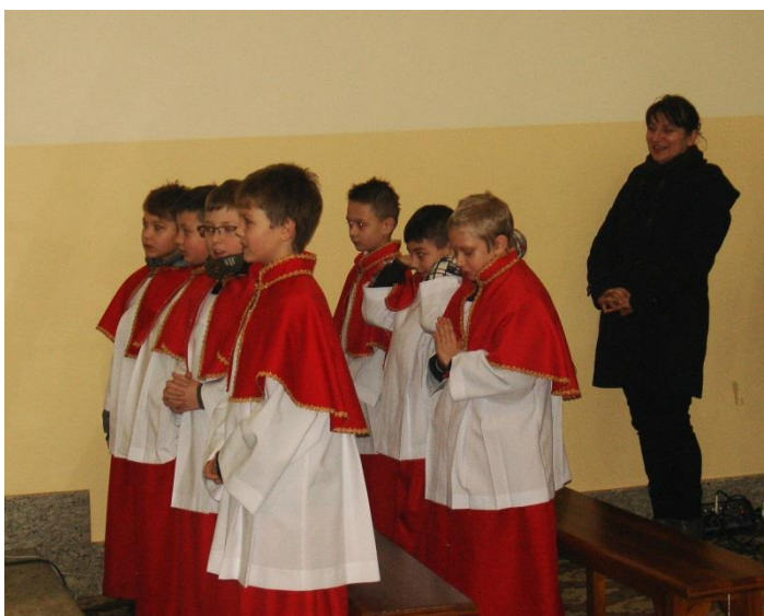
Chłopcy przyjęci do grona ministrantów.