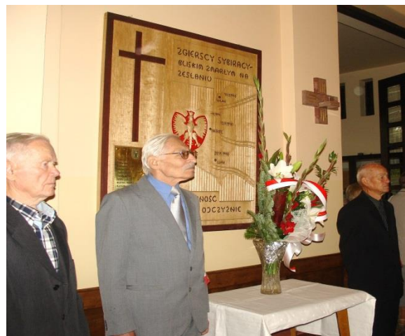
Uroczystości Dnia Sybiraka w naszej parafii.