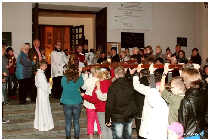
Symbole Światowych Dni Młodzieży w naszej parafii.