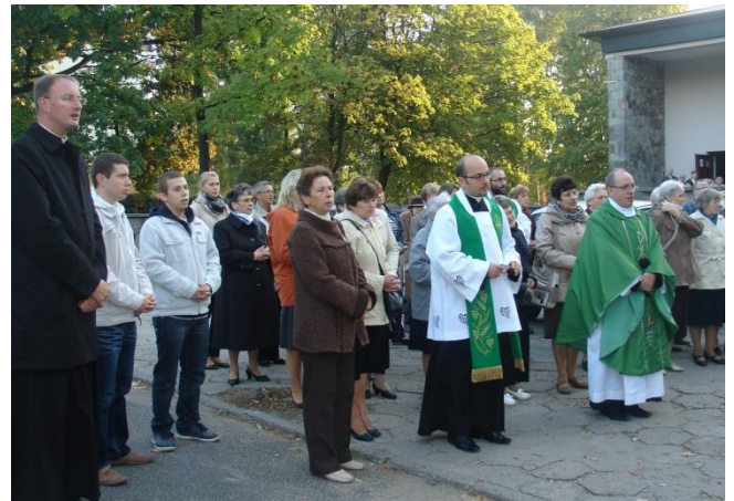
Pożegnanie symboli Świątowych Dni Młodości.