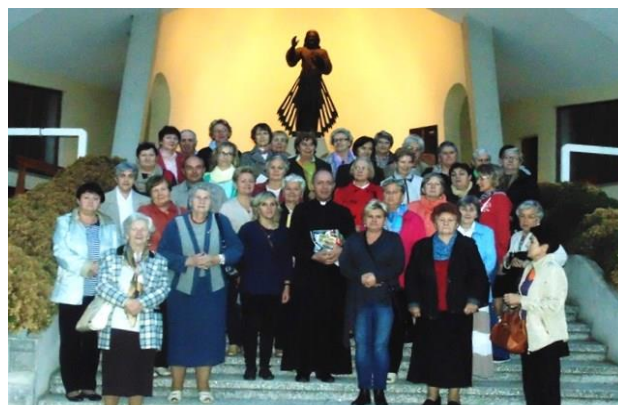
Dolina Bożego Miłosierdzia - Częstochowa

Po zakończonej modlitwie apelowej napełnieni Duchem Modlitwy i uradowani ze spotkania z Naszą Matką z radosnym śpiewem wyruszyliśmy w drogę