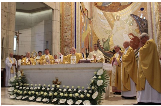
Msza św. w Sanktuarium św. Jana Pawła II