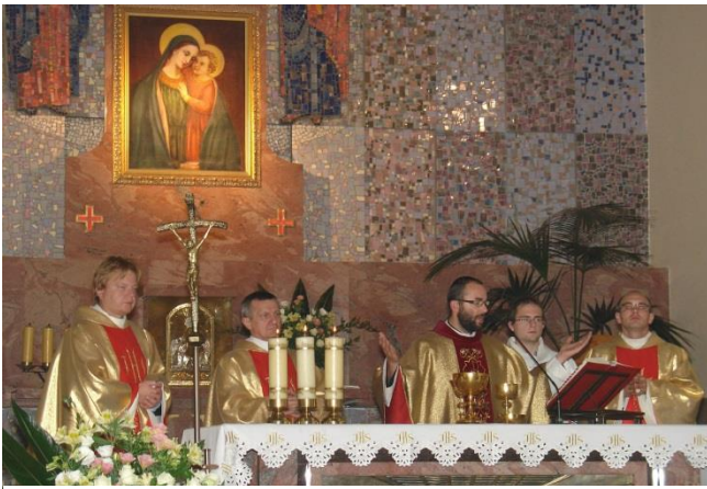
Msza św. podczas peregrynacji symboli ŚDM.