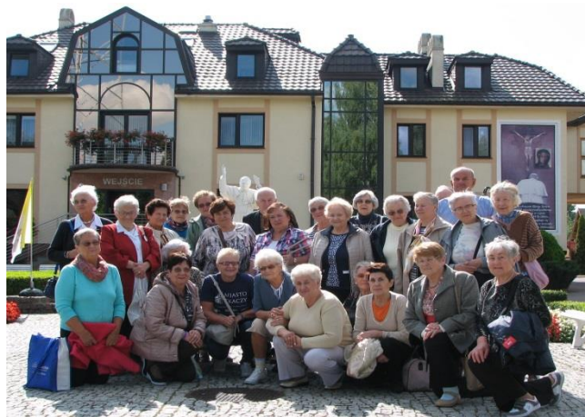
Nasi parafianie w rozgłośni Radia Maryja w Toruniu.