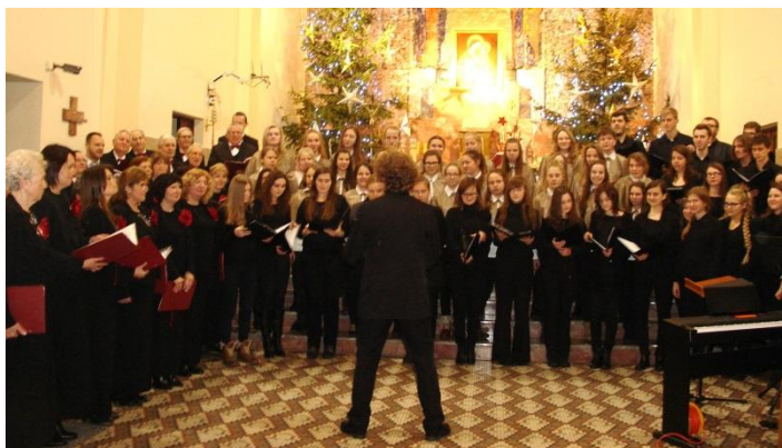
Wspólne zdjęcie chórów, występujących w parafii MBDR, w trakcie koncertu kolęd i pastorałek