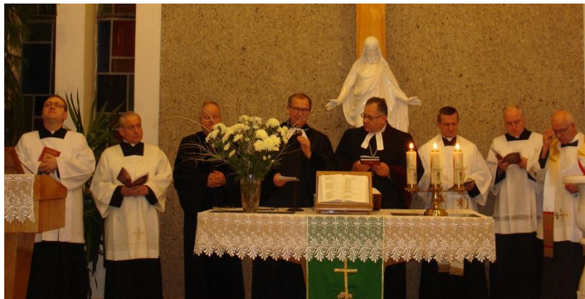
Uroczystości zakończenia Tygodnia Ekumenicznego w Kościele Ewangelicko – Augsburskim w Zgierzu.