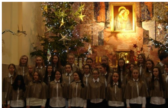
Chór Gimnazjum nr 1 w Zgierzu