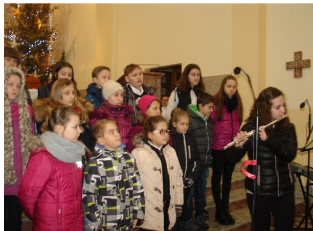
Uczniowie Szkoły Podstawowej nr 8 oraz chór CANTABILE z Państwowej Szkoły Muzycznej I stopnia w Zgierzu.