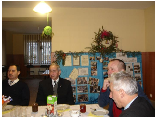
Spotkanie opłatkowe grup parafialnych