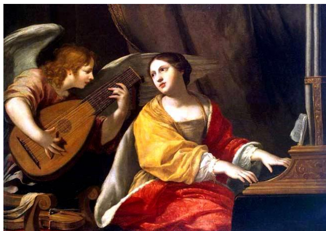
22 listopada - wspomnienie Św. Cecylii dziewicy i męczennicy