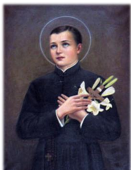
Św. Stanisław Kostka