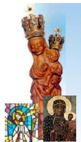
MB Gidelska i Częstochowska

Do domu wróciliśmy późno, właściwie po północy, wszyscy zmęczeni, jednak radośni. Mamy cichą nadzieję na powtórzenie naszej pielgrzymki w przyszłym roku. Będziemy się uśmiechać do ks. Jacka. Każdy pielgrzym wrócił szczęśliwy. Choć na chwilę oderwał się od codziennego wiru życia. Znalazł ukojenie u Naszej Matki. Pozostawił gdzieś w ciemnym kącie swoje zmartwienia i odjechał znów pełen sił na kolejne dni naszego tak w końcu pięknego życia.