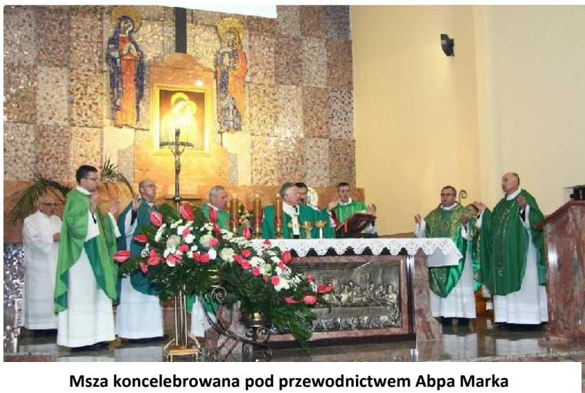
Msza koncelebrowana pod przewodnictwem Abpa Marka Jędraszewskiego

W 25 –tą rocznicę ogłoszenia Adhortacji Laici” współczesny człowiek na nowo odczytuje wskazówki, jak żyć Ewangelią, służąc bliźnim i społeczeństwu. W czasach nowej ewangelizacji należy zwrócić szczególną uwagę na rolę osób świeckich w głoszeniu Ewangelii. Synod Biskupów (II Zgromadzenie Specjalne poświęcone Europie) podkreślił, że świadectwo Słowa winno być