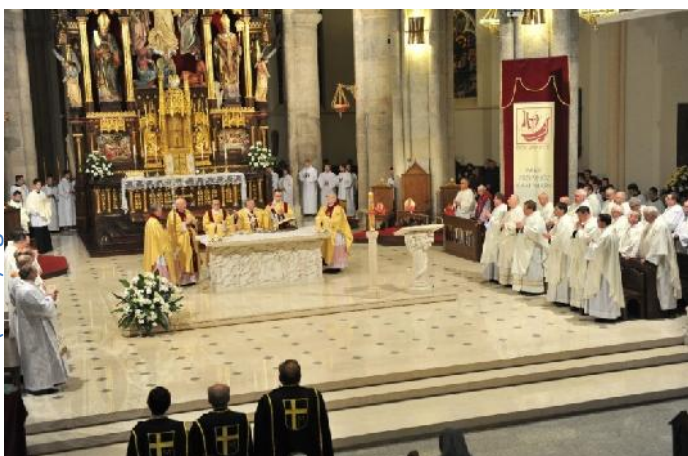
Zakończenie Roku Wiary w archikatedrze

W Archidiecezji Łódzkiej obchody Roku Wiary rozpoczęły się 14 października 2012 roku, a zakończyły 24 listopada 2013r. Podczas Eucharystii wierni w sposób symboliczny podkreślili wyznanie wiary poprzez odmówienie Credo z zapalonymi świecami w dłoniach i odśpiewanie „Te Deum”. Uroczysta Msza święta była wyrazem modlitewnej wdzięczności Panu Bogu za