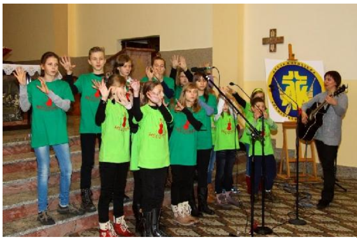
Występ zespołu „Melodyjki”

4. Kończący się Rok Wiary – stracone szanse w dawaniu świadectwa czy błogosławione owoce w moim życiu i życiu parafii?