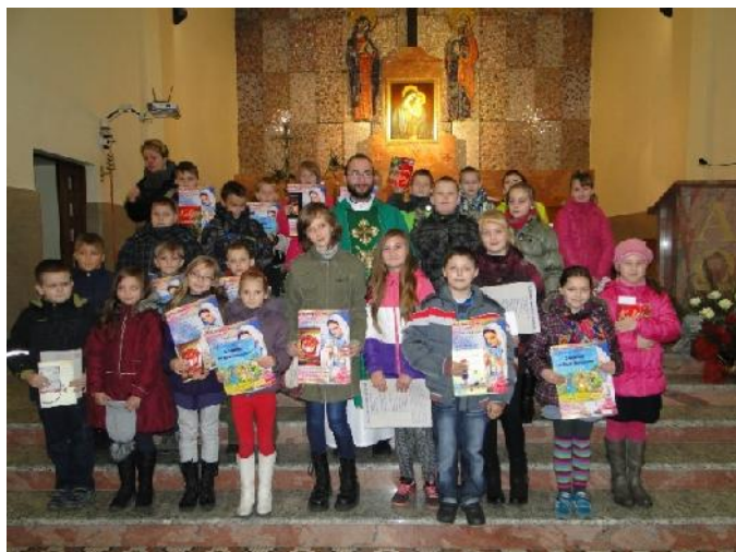
Dzieci nagrodzone za uczestnictwo w nabożeństwie różańca

Zostań koordynatorem w swojej parafii. Zgromadź wokół siebie ludzi. Pójdź do proboszcza i poproś o zamieszczenie informacji o akcji w gazecie parafialnej. Módlcie się szczególnie mocno za kapłanów. W pasmanterii zaopatrzyć się w żółto-białe wstążki i noście je od 8 do 15 grudnia. Na stronie www.miejmyodwage.pl znajdziesz plakat, logotyp,