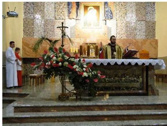
Zakończenie Roku Wiary w naszej parafii