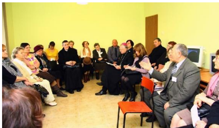
Spotkanie z Abp Markiem Jędraszewskim