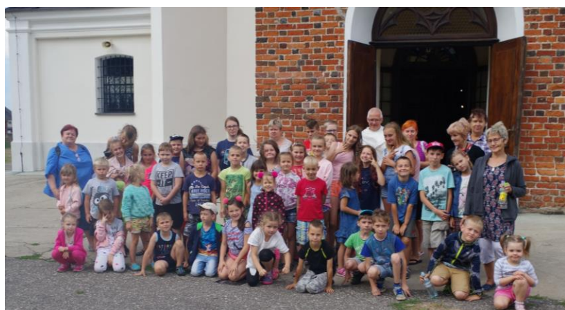
Parafia p.w. Św. Marcina i Klasztor Zakonu Paulinów w Oporowie