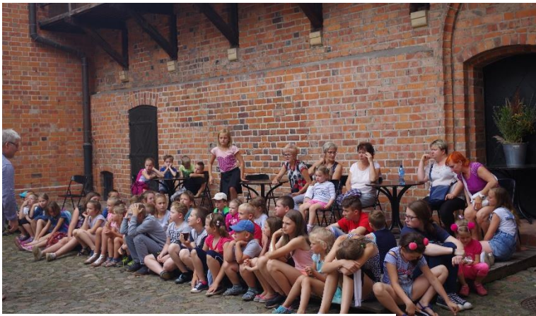
Muzeum Zamek w Oporowie.