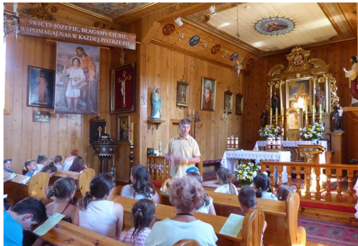
Parafia św. Mikołaja w Chróście.