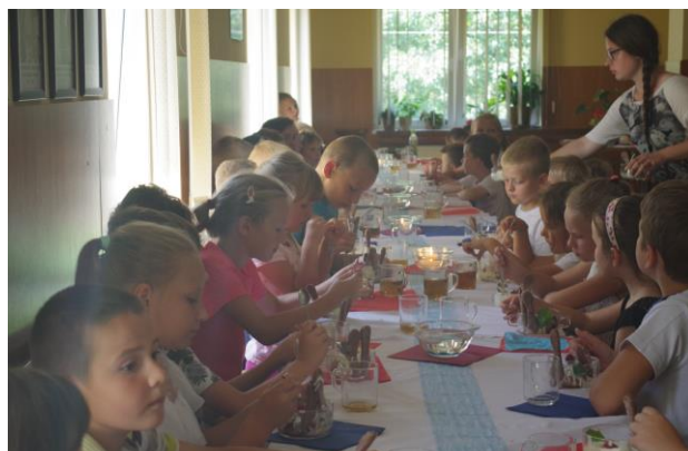
Zajęcia kulinarne – kuchnia włoska.