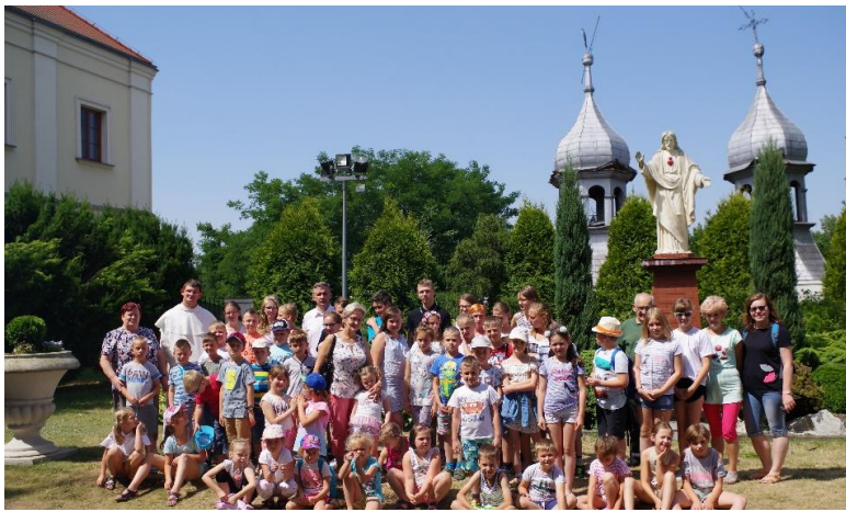
Diecezjalne Sanktuarium Miłosiernego Jezusa Pięciorańskiego w Wieruszowie. Klasztor Ojców Paulinów.