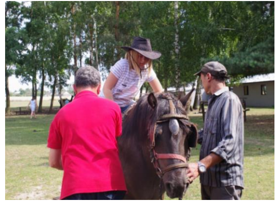
Jazda konna w gospodarstwie agroturystycznym w Chróście.