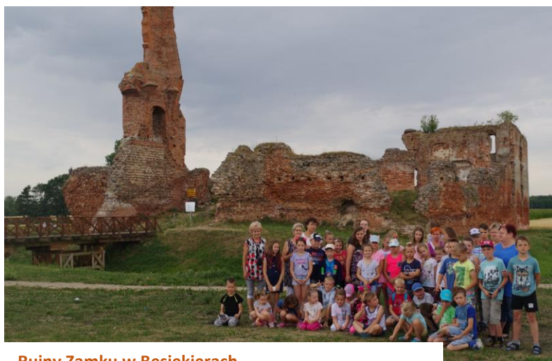
Ruiny Zamku w Besiekierach.