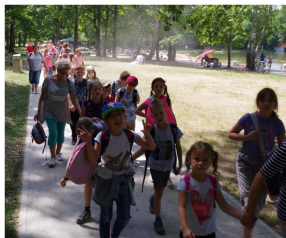
Spacer w Arturówku.