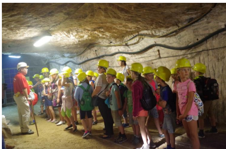
Kopalnia Soli Kłodawa.