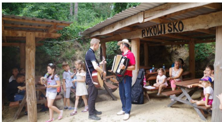
Ognisko w gospodarstwie agroturystycznym w Chróście.