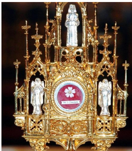
Relikwie św. Faustyny – parafia Archikatedralna św. St. Kostki w Łodzi